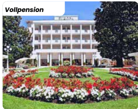
Abano Europa ****

Das Restaurant bietet zum Mittag- und Abendessen ein reichhaltiges Menü, mit internationalen und regionalen Spezialitäten. Sie können zwischen 4 ersten Gängen und 4 zweiten Gängen wählen. Außerdem gibt es ein abwechslungsreiches Vorspeisenbuffet und eine große Auswahl an Desserts. Jeden Donnerstagabend serviert man Ihnen ein Galabuffet bei Kerzenlicht und Klaviermusik.