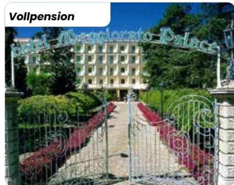
Abano Palace Meggiorato ****